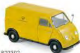
820302 DKW F89 Schnellaster Post