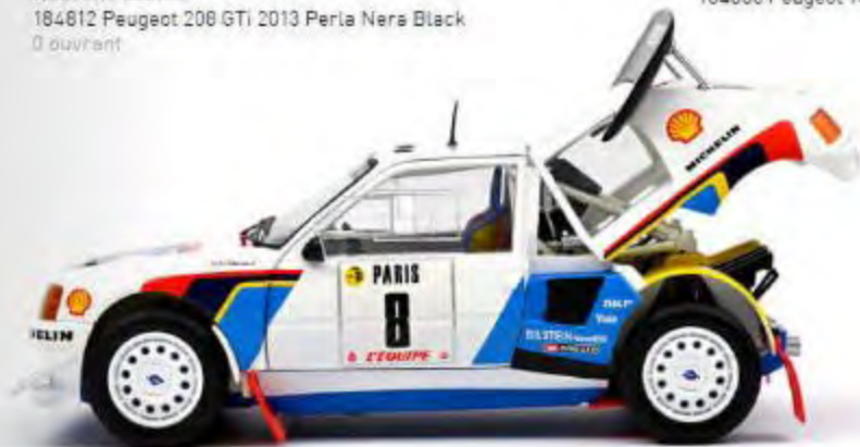
Nouveau modèle 184862 Peugeot 205 T16 Rallye Monte-Carlo 1986 Bruno Saby/J.F. Fauchille 3 ouvert