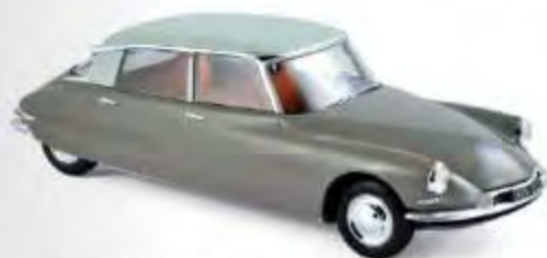
181481 Citroën DS 19 1959 Marron Glacé & Blanc Carrare