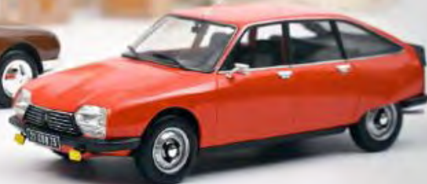
Nouvelle couleur 181628 Citroën GS X2 1978 Ibiza Orange