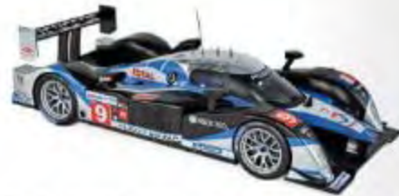
184800 Peugeot 908 HDI FAP Winner France 24H 2009 N°9 Brabham/Gené/Wurz