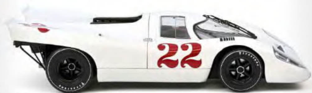
Nouvelle couleur 127504 Porsche 917K 24h France Training 1970 Attwood / Elford