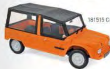
181515 Citroën Méhari 1983 Kirghiz Orange 3 ouvrants