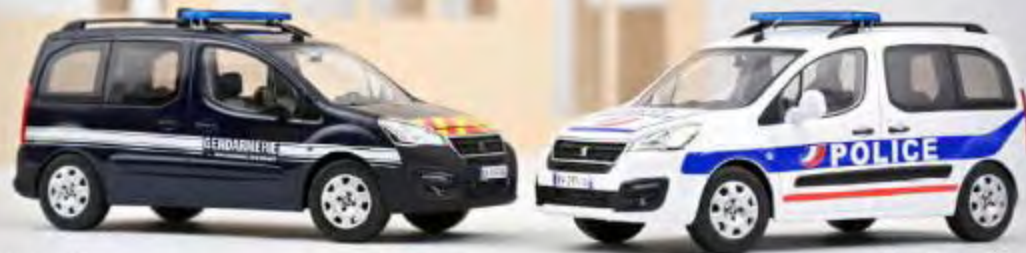
Nouveau modèle 184890 Peugeot Partner 2018 "Gendarmerie"

The very first car to bear the name Porsche is the unique 356/1, built in 1948. It is, thus, the ancestor of one of the most successful manufacturers in motorsport history and the start of a legendary line of sport cars.