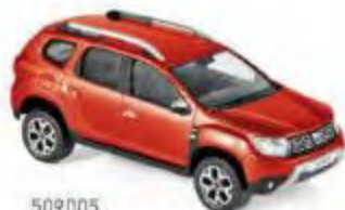
509005 Dacia Duster 2018 Flamme Red