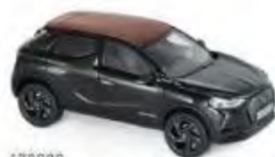
170020 DS 3 Crossback "La Première" 2019 Black & Red roof