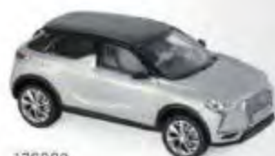
170022 DS 3 Crossback E-Tense 2019 Pearl & Black roof