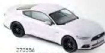
270556 Ford Mustang 2016 White