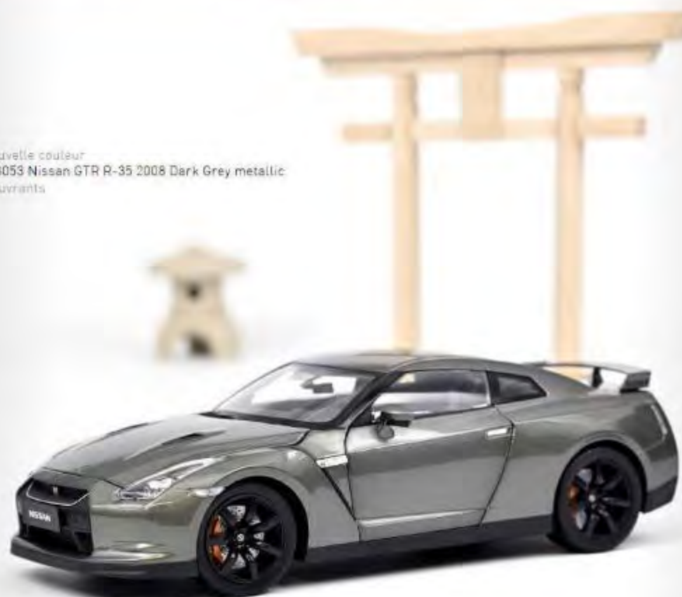
Nouvelle couleur 188053 Nissan GTR R-35 2008 Dark Grey metallic 4 ouvrants

In 1999, financial difficulties brought Nissan and Renault closer together so that the two brands could draw on their respective expertise.