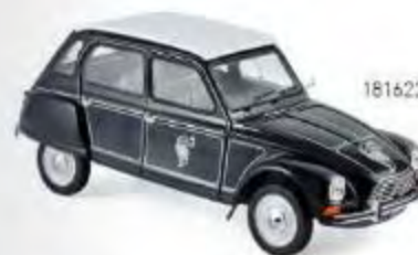
181622 Citroën Dyane 6 1977 "Caban" 4 ouvrants