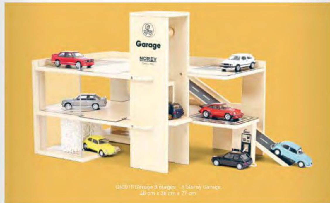
G43010 Garage 3 etages - 3 Storey Garage 48 cm x 36 cm x 27 cm