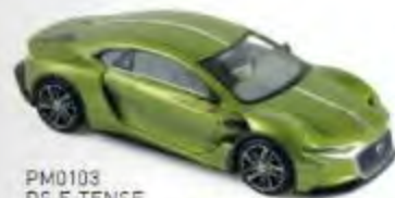
PM0103 DS E-TENSE Salon de Genève 2016