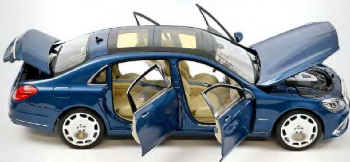
Nouveau modèle 183425 Mercedes-Maybach S650 2018 Blue metallic 4 ouvrants