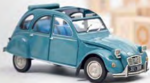
Nouvelle couleur 181492 Citroën 2CV 6 Club 1982 Lagune Blue 4 ouvrants