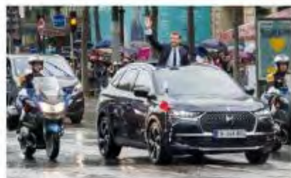
WWK in progress / A venir 170012 DS 7 Crossback Presidential 2017 & figure