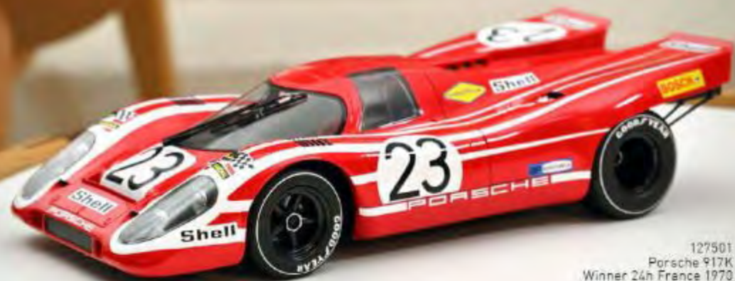
127501 Porsche 917K Winner 24h France 1970 Attwood / Herrmann