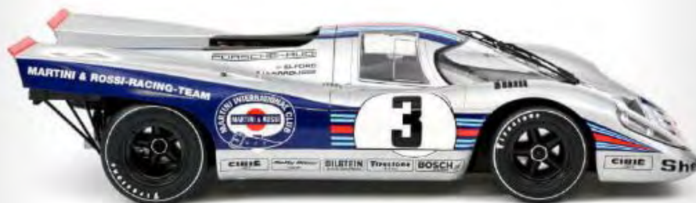
Nouvelle couleur 127503 Porsche 917K Winner 12h Sebring 1971 Elford / Larrousse