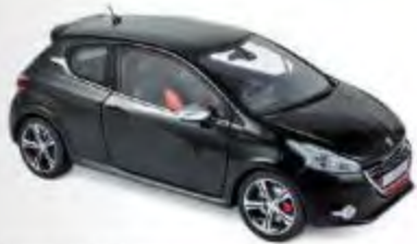
Nouvelle couleur 184812 Peugeot 208 GTi 2013 Perla Nera Black 0 ouvert