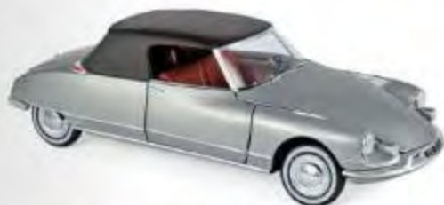
181598 Citroën DS 19 Cabriolet 1961 Pearl Grey 4 ouvrants