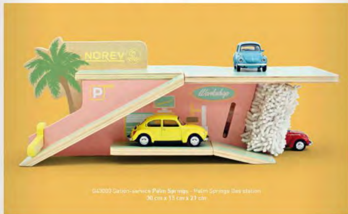
G43000 Station-service Palm Springs - Palm Springs Gas station 30 cm x 15 cm x 27 cm