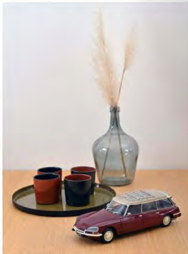
181592 Citroën Break 21 1970 Bordeaux 5 ouvrants