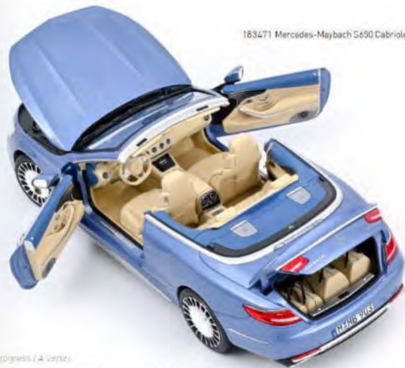
183471 Mercedes-Maybach S650 Cabriolet 2018 Blue metallic 4 ouvrants