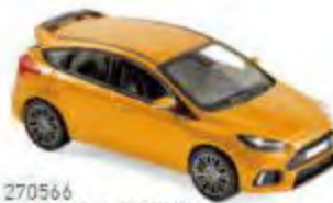
270566 Ford Focus RS 2018 Orange metallic