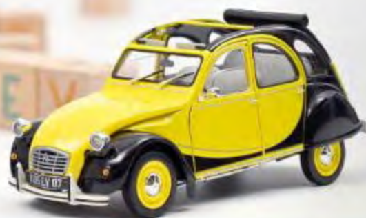
Nouvelle couleur 181493 Citroën 2CV Charleston 1982 Helios Yellow & Black 4 ouvrants