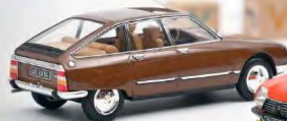
Nouvelle couleur 181627 Citroën GS Pallas 1978 Cigale Brown