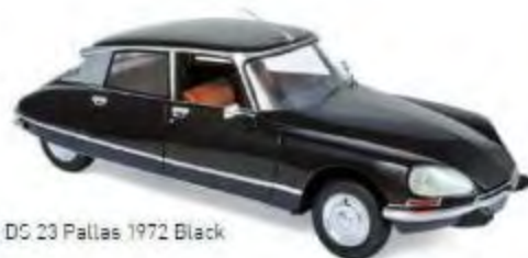
181482 Citroën DS 23 Pallas 1972 Black 4 ouvrants