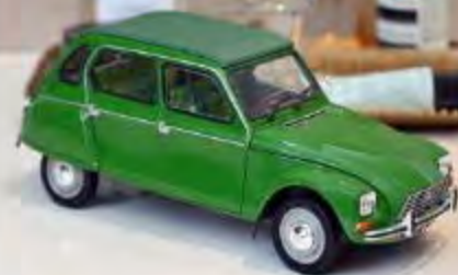
181621 Citroën Dyane 6 1975 Tuileries Green 4 ouvrants