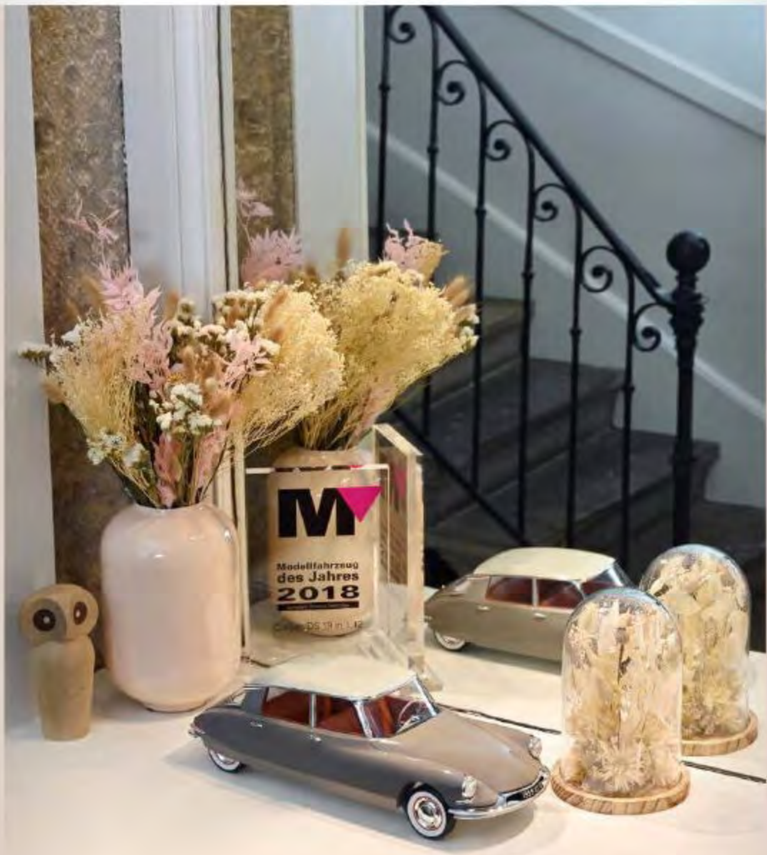
121562 Citroën DS 19 1959 Marron Glacé & Blanc Carrare 0 ouvert