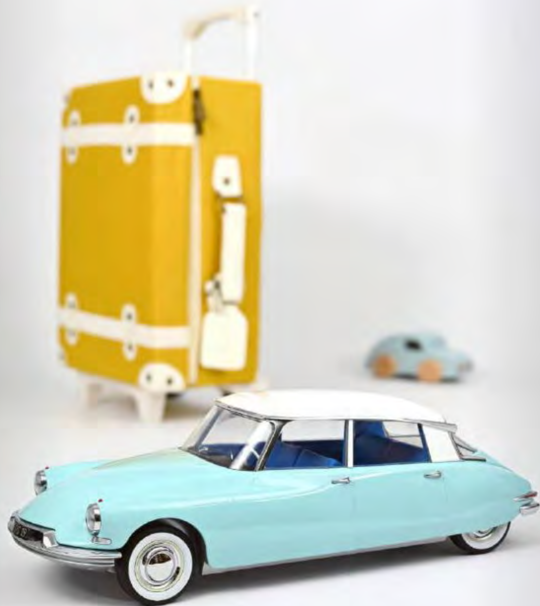
Nouvelle couleur 121564 Citroën DS 19 1959 Bleu Nuage & Blanc Carrare 0 ouvert