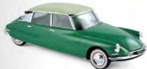
181480 Citroën DS 19 1956 Vert Printemps & Champagne