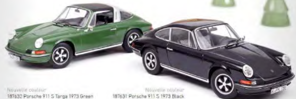
Nouvelle couleur 187632 Porsche 911 S Targa 1973 Green